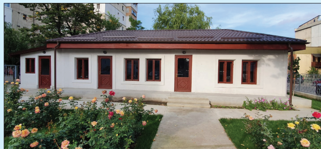
Casa Dej - Centru de informare și documentare privind regimurile totalitare din România