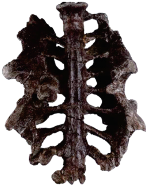
UBB V649 – fragment de pelvis (bazin)

Până la descoperirea din țara noastră, se considera că Gargantuavis este o „pasăre” ce și-a pierdut capacitatea de a zbura din cauza izolării într-un mediu insular. Mărimea acesteia (a se vedea imaginea) era comparabilă cu cea a unui struț actual. Totul, până la descoperirea unei noi fosile în zona Hațegului. Ea a fost colectată în localitatea fosiliferă Nălaț-Vad (în apropiere de Hațeg, Județul Hunedoara, a se vedea imaginea) descoperită de paleontologi clujeni, unde apar la suprafață depozite continentale de origine fluvială cretacic superioare (aproximativ 70 milioane ani). Noua descoperire semnifică prima semnalare a acestui animal în afara Franței și Spaniei. Este de asemenea și cel mai complet pelvis (a se vedea imaginea) cunoscut până la ora actuală.