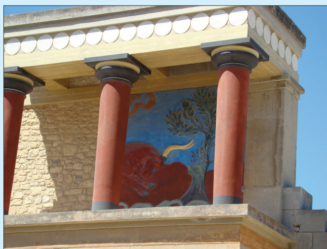
Palatul din Knossos, simbol al civilizației minoice, locul labirintului ridicat de Daedalus și fiul său Icar