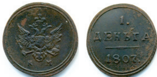
1 denga, 1/2 kopek 1807, tip I 15

Astfel de monede, cu caracteristici asemănătoare, cercuri concentrice, un cerc perlat exterior și inițialele monetăriei imprimate pe revers, ce pot fi considerate variante, au fost bătute și la monetăria Ecaterinburg EM, în anii: 1802, 1803, 1804, 1805, 1808 și 1810 14 .