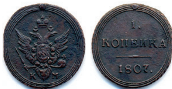
1 kopeika 1807, tip I 19

Astfel de monede, cu caracteristici asemănătoare, cercuri concentrice, un cerc perlat exterior și inițialele monetăriei imprimate pe revers, ce pot fi considerate variante, au fost bătute și la monetăria Ecaterinburg EM, în anii: 1804, 1805, 1808 și 1810 18 .