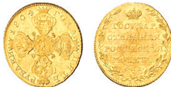
5 ruble 1804, tip I 51