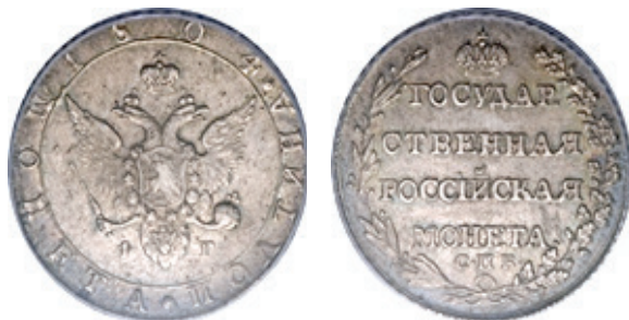
50 kopeiki/1 poltina/1/2 ruble 1804, tip I 43

Alături de inițialele meșterului monetar Feodor Gelman – ФГ întâlnim și inițialele meșterului Alexey Ivanov- АИ . Aceste monede pot fi considerate variante.