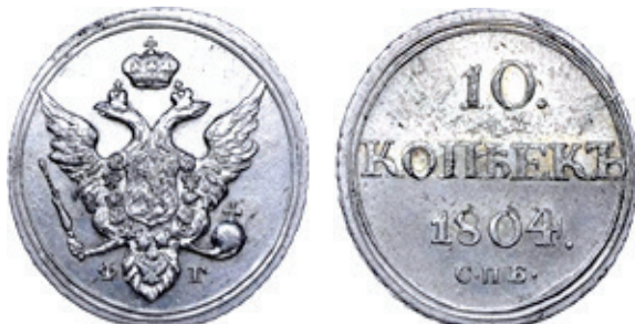
10 kopeiki 1804, tip I 32

Astfel de monede, cu caracteristici asemănătoare, cercuri concentrice, cerc perlat exterior și inițialele monetăriei imprimate pe revers, ce pot fi considerate variante, au fost bătute și la monetăria Ecaterinburg EM , între anii: 1802 și 1810 30 . La monetăria Ecaterinburg EM au fost bătute mai multe variante: fără cercuri concentrice la puncte (1802), coada vulturului cu o grafică diferită (1805), coroana de deasupra vulturului mică sau mai mare 31 .