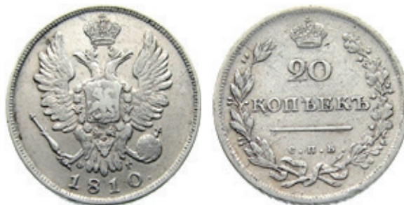
20 kopeiki 1810, tip I 36

Monede cu caracteristici asemănătoare, fără cercuri concentrice, ce pot fi considerate variante, au fost bătute la monetăria Saint Petersburg, C.П.Б. , între anii: 1808, 1809 și 1810 avându-i ca meșteri monetari pe Feodor Gelman – ФГ (1808, 1809 și 1810) și Mikhail Kleiner – МК (1809 și 1810) 35 .