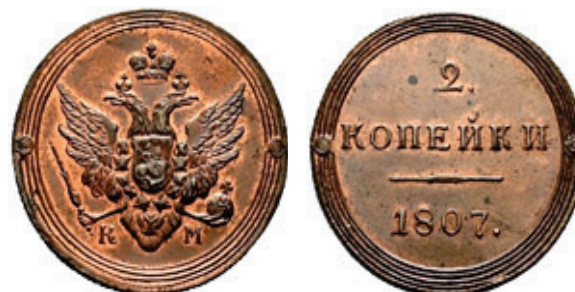
2 kopeiki 1807, tip I 23

Astfel de monede, cu caracteristici asemănătoare, ce pot fi considerate variante, au fost bătute și la monetăria Ecaterinburg EM, în anii: 1804 și 1805 22 .