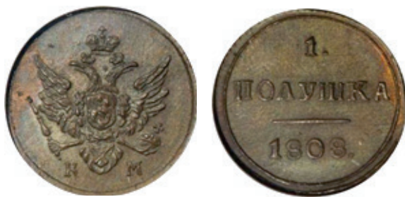
1 polushka, 1/4 kopek 1808, tip I 11

După urcarea pe tronul Rusiei a țarului Alexandru I (1801-1825) sunt emise monede din aur (imperiali / 10 ruble și ½ imperiali / 5 ruble), de argint (1 rubla, 50 de copeici / poltina, 25 de copeici / polupoltinnik, 20 de copeici, 10 copeici) și cupru (5 copeici, 2 copeici, 1 copeika, ½ copeica / denga și ¼ copeika / poluška). Moneda de argint a fost împărțită, oficial, în monedă de bancă cu titlul de 83 și 1/3% (1,5 ruble, 1 rublă, 75, 50 și 25 de copeici) și monede divizionare cu titlul de 72% (20, 10 și 5 copeici) 10 .