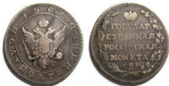
25 kopeiki/1 polupoltinnik/1/4 ruble 1804, tip I 40

Alături de inițialele meșterului monetar Feodor Gelman – ФГ întâlnim și inițialele altor meșteri: Pavel Stupitsyn – ПС , Mikhail Feodorov – МФ , Pavel Danilov – ПД , Nikolay Grachev – НГ 39 . Aceste monede pot fi considerate variante, la fel ca și monedele care au un model diferit de coroană, mai îngustă, pe revers, deasupra valorii.