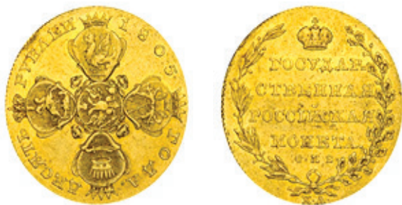
10 ruble 1805, tip I 54

Metal-aur 986 ‰. Muchie zimțată oblic. Diametru: 28 mm. Greutate: 12,17 g. 55 . Monetărie: Saint Petersburg, С•П Б •. Fețe amplasate medalistic. Intrată în circulație în anul 1802. Au fost bătute trei emisiuni, în anii: 1802, 1804 și 1805. Meșter monetar Christophor Leo- ХЛ. Tiraj total cunoscut: 55.000 de exemplare 56 .