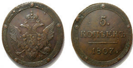
5 kopeiki 1807, tip I 27

Astfel de monede, cu caracteristici asemănătoare, cercuri concentrice și inițialele monetăriei imprimate pe revers, ce pot fi considerate variante, au fost bătute și la monetăriei Ecaterinburg EM , în anii: 1802 și 1803 26 .