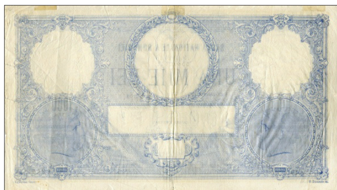
1000 lei 1916 45 (tip II, mai 1910-iunie 1933)

Dimensiune: 218 x 126 mm. Filigran: Zeița Roma în medalionul din stânga în profil spre dreapta, împăratul Traian în medalionul din dreapta în profil spre stânga, monogramă „BNaR” în medalion circular, „1000 LEI” în cartuș dreptunghiular, cu zerourile drepte, capetele ovale, „LEI” scris cu majuscule și „1000” în cartuș dreptunghiular, culoare mai închisă decât hârtia 46 .