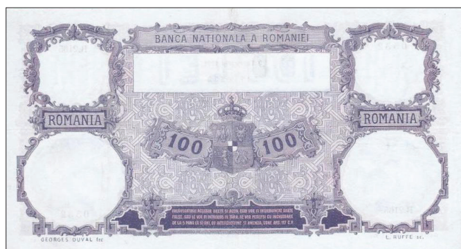
100 lei 1921 40 (tip II, ianuarie 1910- ianuarie 1942)

Dimensiune: 196 x 113 mm. Filigran: Zeița Roma în medalionul din stânga în profil spre dreapta, împăratul Traian în medalionul din dreapta în profil spre stânga, monograma „BNR” în medalion ornamentat (privită pe avers este inversată), „100 LEI” în cartuș dreptunghiular, cu zerourile drepte, capetele ovale, „LEI” scris cu majuscule 41 .