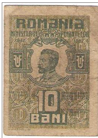
10 bani 1917

Dimensiune 33/ 44 mm. Hârtie albă. Desenator Horațiu Sava Dumitriu 28 .