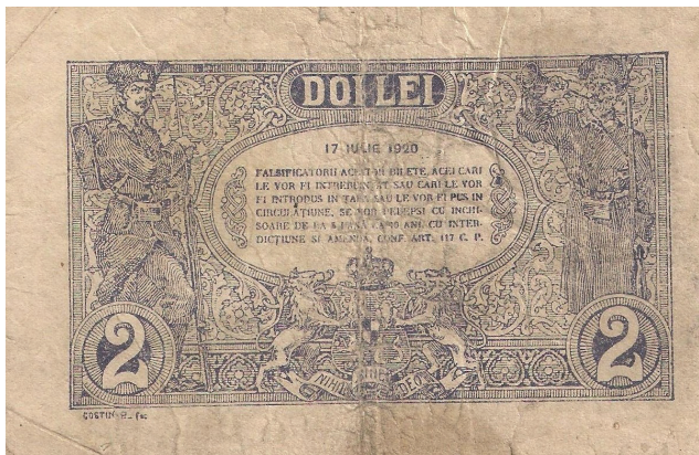
2 lei 1920 (tip unic, martie 1915 - decembrie 1938)