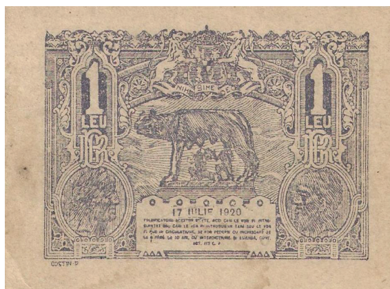
1 leu 1920 (tip I, martie 1915 - decembrie 1938)

Dimensiuni: 80 x 55 mm. Hârtie fără filigran. Filigran au doar emisiunile din 28 octombrie 1937 și 21 decembrie 1938, un filigran ce conține sigla „BNR” ce are literele suprapuse, scrise cursiv și legate între ele. Emisiunea din 17 iulie 1920 are hârtia