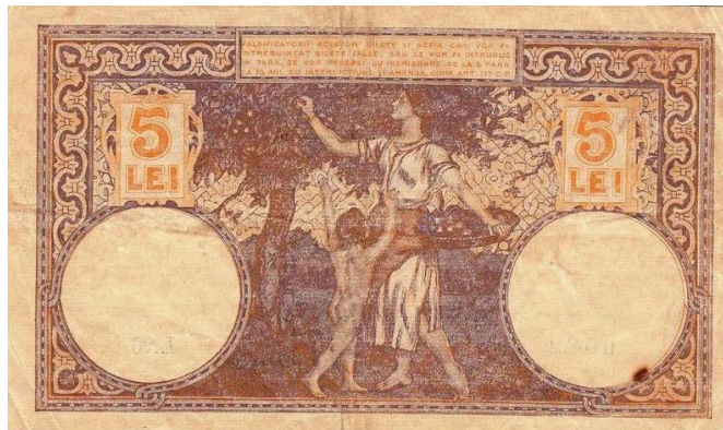
5 lei 1916 6 (tip I, iulie 1914-septembrie 1929)

Dimensiuni: 132 x 79 mm. Filigran: culoare mai deschisă decât hârtia, Traian în medalionul din stânga în profil spre dreapta și Zeița Roma în medalionul din dreapta în profil spre stânga 7 .