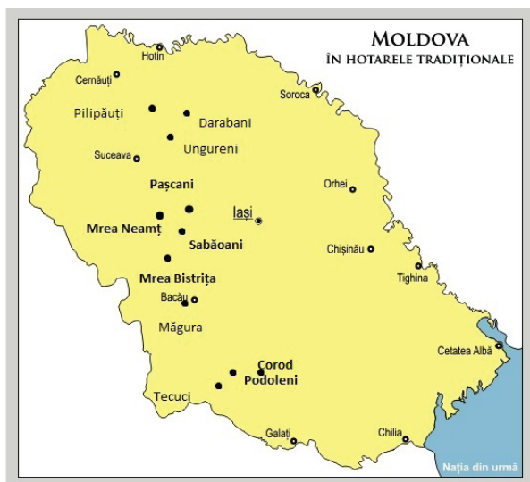
Harta 1: tezaurele cu monede suedeze dintre Siret și Prut

Asta nu exclude existența altor tezaure sau monede izolate care pot modifica distribuția geografică, mai ales că ele sunt prezente pe site-urile vânzări online. 40