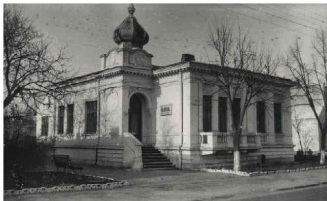
Imobil în care a locuit generalul Constantin Prezan în perioada cât a staționat în Bârlad.

Orașul s-a văzut pus în fața unor situații limită, fiind nevoit să se ridice la nivelul noului statut. Totodată orașul a devenit și un important loc de retragere nu numai pentru instituțiile militare, familia regală dar și pentru civili, populația Bârladului crescând brusc de 2-3 ori, de la 26.500 la peste 60.000 de locuitori 20 , ospitalitatea bârlădenilor fiind pusă la grea încercare.