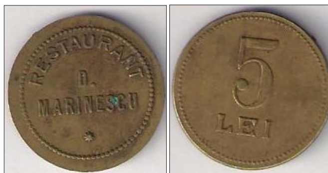
Restaurant D. Marinescu

O parte din jetoane au fost emise pentru strângerea de fonduri necesare pentru ridicarea unor monumente închinat eroilor 14 din primul război mondial în diverse zone ale țării sau pentru construirea unor clădiri culturale de interes național (Ateneul Român, Arcul de Triumf ș.a.).