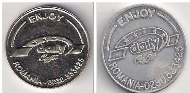
Jetoane pentru automatele de cafea

După 1990, datorită utilității lor jetoanele au reapărut pe piața românească. La început au fost folosite jetoane aduse de diverse firme străine însă ulterior au fost realizate și la noi fiind personalizate cu datele emitenților. Astfel, astăzi circulă jetoane pentru diverse automate, de cafea, de jocuri mecanice, de cazinouri sau chiar jetoane de prezentare a unor firme ce își desfășoară activitatea în diverse zone din țară 18 .