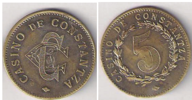
Cazinoul din Constanța

Valoarea înscrisă pe jetoane poate fi un echivalent bănesc, exprimat explicit în bani/lei, zile de muncă, o anumită marfă, pâine, carne, porție de mâncare, băutură 7 (țap, halbă, sticlă de bere, sifon ș.a.), tutun sau un anumit serviciu, o călătorie cu tramvaiul, cu ascensorul, o convorbire telefonică 8 . Valorile cele mai mari le întâlnim la jetoanele de cazinou: 10.000 pentru o piesă a Cazinoului din Sinaia 9 , din perioada interbelică și 1.000.000, pentru cele folosite înainte de denominalizarea leului 10 . Jetoanele cu valorile nominale de: 5 lei, 20 de lei, 100 de lei și 500 de lei emise de patronii cazinoului din Sinaia aveau putere de cumpărare nu numai în incinta cazinoului ci și în orașul Sinaia și chiar în împrejurimi fiind primite de orice negustor 11 .