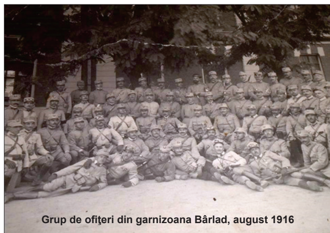
Grup de ofițeri din garnizoana Bârlad, august 1916