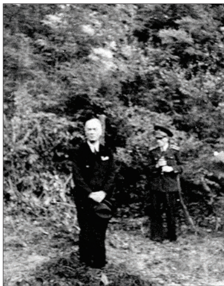
Mareșalul Ion Antonescu în fața plutonului de execuție al NKVD, în Valea Piersicilor, lângă închisoarea Jilava, 1 iunie 1946

încălcat mandatul de numire și nu a creat un guvern de uniune națională. În timpul procesului din 1946, când i s-au adus aceste acuzații, a dat vina pe liderii politici ai partidelor istorice, care au refuzat să participe la un guvern dictatorial, xenofob, pro-german 5 .