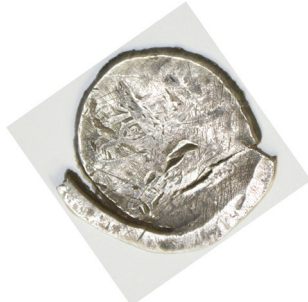
Billon. Kuruş Abdulhamid (1774-1789), 18.15 grame, Constantinopol Nuri Pere p.224, nr.675

Monedele otomane constituie principalul nominal pe piața românească încă din sec.XV. Perioada din care datează monedele reprezintă o perioadă de criză din istoria Imperiului Otoman, perioadă care culminează cu marea devalorizare din anii '20 – '30 ai sec. XIX. Kuruş-ul este nominalul principal otoman, ele concurând cu nominalurile din argint olandeze și spaniole. El se menține la o greutate de peste 18 grame din care 60% argint. 2 În 1789 se produce o masivă devalorizare kuruş-ul ajungând la puțin peste 12 grame din care 54% argint. Primele două monede ca și ultima par a fi monede folosite ca imitații decorative folosite pe post de accesorii feminine. Pledează găurile din cele trei monede ca și starea bună de păstrare a monedelor.