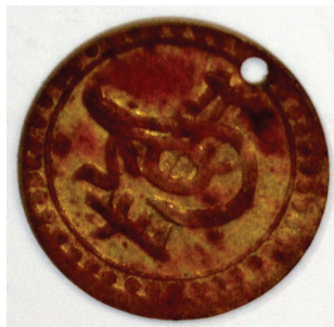
AE. Para. Mustafa III (1757-1774), 0.36 grame, perforată, Constantinopol Nuri Pere 1 p.216, nr.639