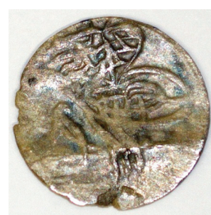
Billon. Para. Abdulhamid (1174-1789), Nuri Pere p.225/nr.681, 0.78 grame