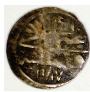
Billon. Para. Abdulhamid (1174-1789), 0.79 grame Nuri Pere p.2245 nr.681