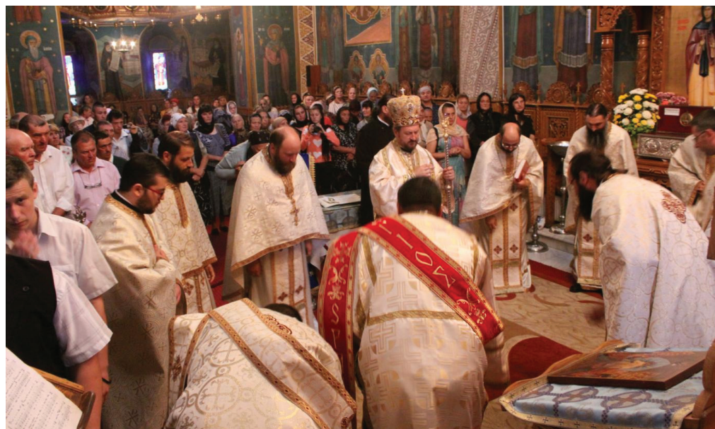
Sfânta Muceniță Chiriachi, serbată la Catedrala Episcopală din Huși