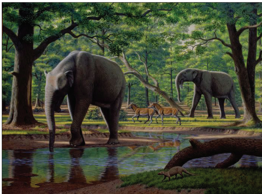
Fig. 6 – Deinotheri în medii specifice de viață, i.e. proximitatea cursurilor de apă (reconstituit de Mauricio Antón, https://www.google.com/search?q=deinotherium&newwindow=1&espv=2&source=inms&tbm=isch&sa=X&ved=0CAcQ_AUoAWoVChMlh6nw4K6ryAIVxtksCh3POwMU&biw=1246&bih=725#imgcr=-OXYZ7YJtoMhCM%3A )

această lucrare, Ștefănescu a apelat la un specialist al vremii, belgianul Louis De Pauw , preparator al Muzeului de Științele Naturii din Bruxelles, celebru pentru conservarea și montarea – sub coordonarea lui Louis Dollo a