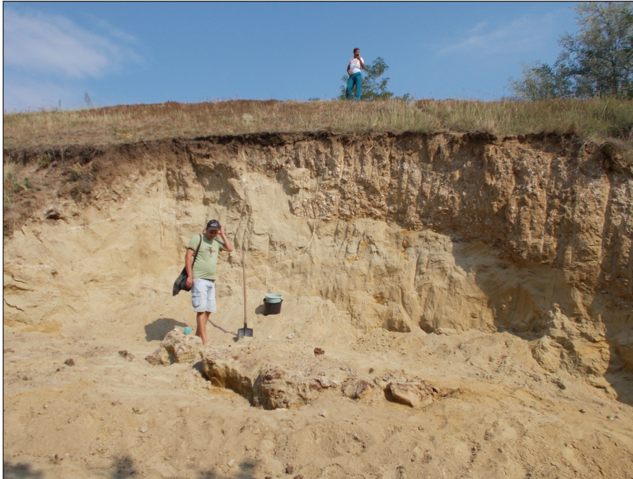
Fig. 2 – Vedere de ansamblu asupra sitului de la Gherghești în care a fost descoperit deinotheriul de talie mare, pe calea Zaharoaia.

Cu alte cuvinte, deinotherii trebuie priviți ca și un grup de proboscidiieni aberanți, păstrători ai unor caractere arhaice prin comparație cu cei evoluți. De altminteri, așa sunt și priviți în schemele filogenetice, în care apar ca o ramură distinctă care se stinge fără descendenți. Dar dacă este să discutăm filogenia, atunci fără îndoială trebuie să analizăm câteva aspecte, îndeosebi legate de stratigrafie. Multă vreme s-a crezut că cei mai vechi reprezentanți nu sunt mai vechi decât Miocenul Inferior. Descoperiri relativ mai recente demonstrează însă că avem de a face cu forme apărute la finalul Paleogenului, mai exact în Oligocen, acum 28-27 milioane de ani. Cel mai vechi taxon ar fi Chilgatherium harrisi , descoperit în Etiopia. Originile africane ale grupului nu sunt însă surprinzătoare, dacă este să ne gândim la originea proboscidiienilor, care se află în același continent: Eritherium azzouorum este cel mai vechi proboscidian deocamdată cunoscut, care a viețuit în Paleocenul terminal (Thanetian), semnalat din Maroc. Așadar, Africa a fost leagănul proboscidiienilor, din acest continent aceștia dispersându-se spre restul continentelor relativ târziu, în Miocenul Inferior. Până la dispersia despre care amintim, grupul s-a diversificat fără îndoială în interiorul aceluiași continent. Un eveniment tectonic le-a creat însă oportunitatea să părăsească Africa și să invadeze pe de o parte Eurasia, iar apoi