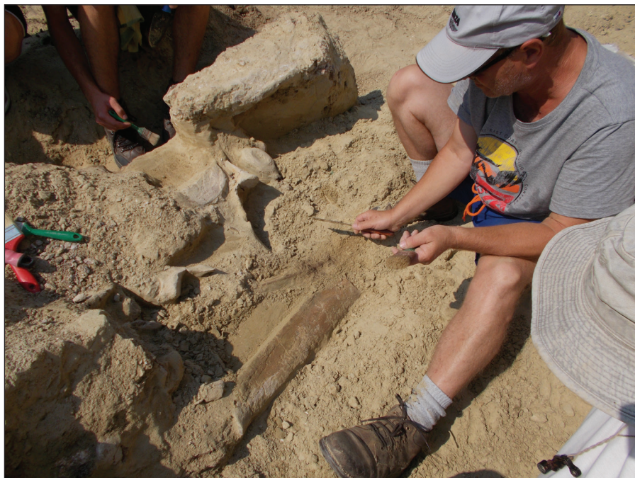
Fig. 5 – Imagine a dispunerii pe suprafață a anumitor oase de deinother, care evidențiază pierderea conexiunilor anatomice.

Vârsta depozitelor geologice de la Mânzați ar reveni Meotianului (Miocen superior, între 9,88-7,1 milioane de ani). Rocile în discuție s-au format în mediu continental, într-un sistem fluvial. Un astfel de context sedimentar ne pune în fața provocării lui De Pauw, fiindcă în câmpiile fluviale într-adevăr, oasele sunt adeseori deplasate de către curenții de