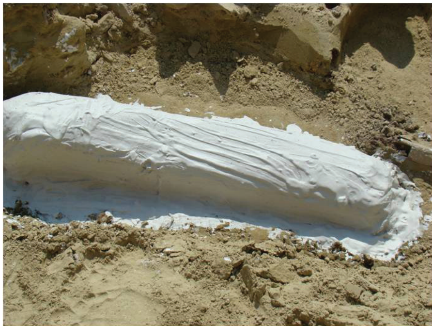
Fig. 4 – Os lung de deinoter cofrat în ipsos, preparat în vederea extragerii din rocă.

secolului al nouăsprezecelea: la Mânzați (actualul județ Vaslui, însă pe atunci județul Tutova), profesorul universitar bucureștean Gregoriu Ștefănescu prin săpături efectuate între 1890-1894 aducea la zi un aproape întreg schelet al unui deinoter de talie deosebit de mare. Prin această descoperire, profesorul nu făcea decât să persevereze, fiindcă cu ceva ani înainte reperase fosile similare și mai la sud, la Găiceana (fostul județ Tecuci), în locul numit Fundul Boghiții. Dimensiunile mari ale animalului i-au reținut încă de pe atunci atenția, însă noul schelet confirma pe deplin cele deja constatate, motiv pentru care a și numit acest proboscidian Deinotherium gigantissimum , o numire excelent aleasă, fiindcă transpune în latină superlativul dimensional. Ștefănescu preciza în 1895: „Cred așadar că deinoterii de la Mânzați și Găiceana, care sunt cu mult mai mari decât toți ceilalți, trebuie să revină unei noi specii, pentru care numele specific cel mai potrivit ar fi superlativul lui giganteum , care va să zică gigantissimum ”. Problema care apare însă legat de acest nume al speciei este una de prioritate: cu peste jumătate de secol mai devreme un paleontolog – dar și fizician și naturalist cu varii contribuții altele decât paleontologia - cu notorietate pentru epoca sa, Karl Eduard von Eichwald , descria în 1831