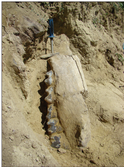
Fig.3 – Fragment de mandibulă cu dinți jugali asociați.

modestă (cu unele rare excepții, precum Eppelsheim în Germania) și cei de talie foarte mare. Așadar, o încadrare a tuturor deinoterilor miocen medii-superiori la