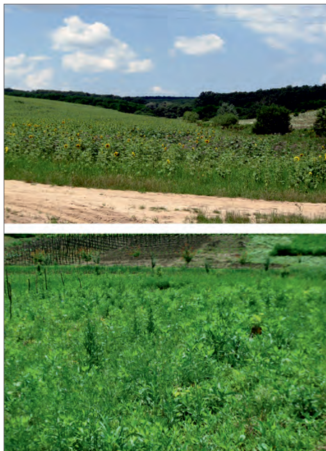
Planșa III Vedere generală situl Lohan-Vadul Teiului