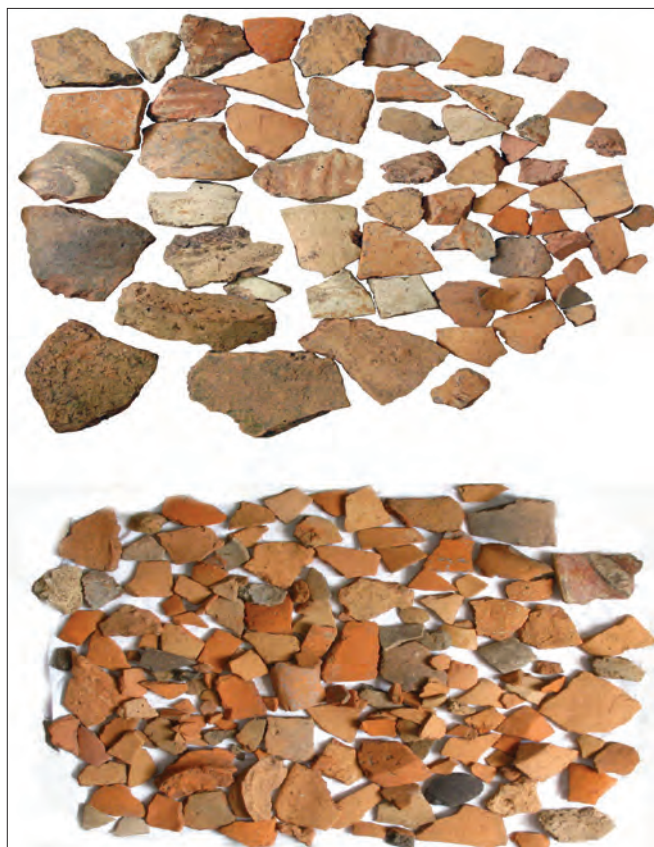
Planșa IV Materiale descoperite în situl Lohan-Vadul Teiului