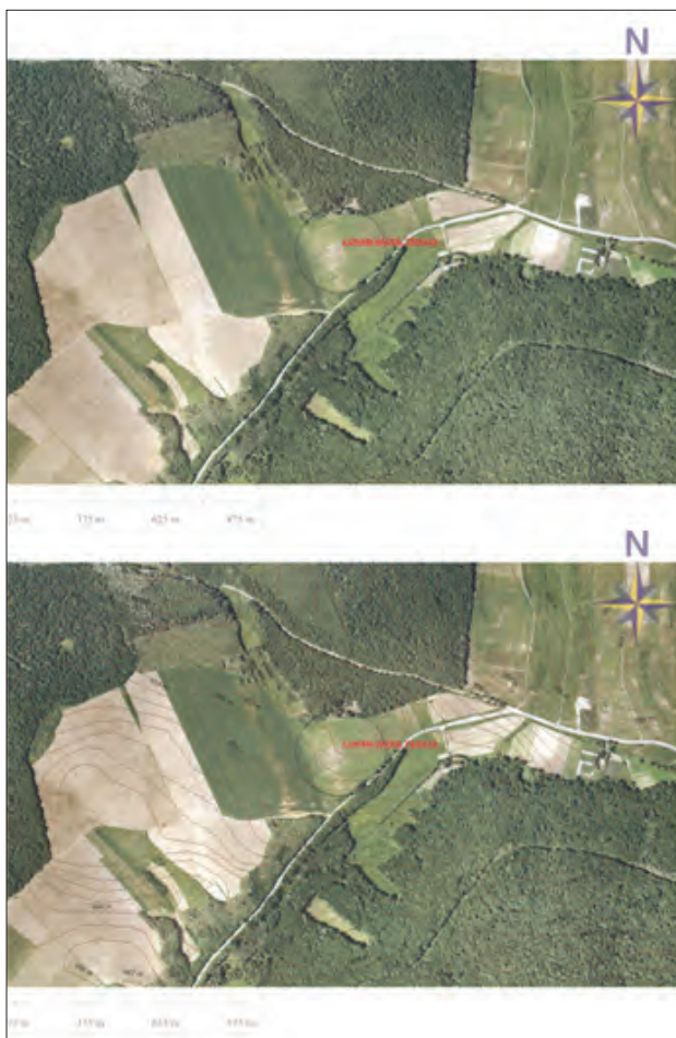
Planșa II 1, 2 Situl Lohan-Vadul Teiului