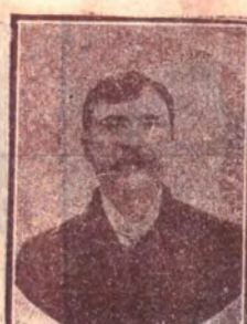
Grigore Hăpășanu Cărligați