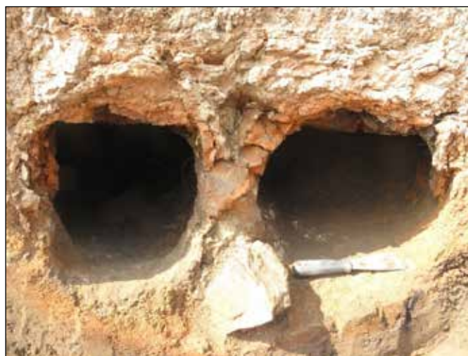
Cuptorul medieval de la Bazga

Lungimea totală a cuptorului, pe direcția E-V, este de 1,90 m (galeria din stânga) și 1,80 m (galeria din dreapta), cu lățimea maximă de 1,10 m. Lățimea galerii din dreapta, la mijloc, este de 40 cm, iar pentru cea din stânga de 30 cm.