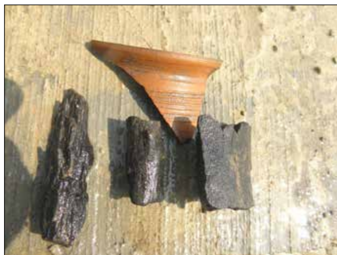
Cărbuni de tip "cocs" (mangan)

"Tavanul" cuptorului prezintă amprente de tip "dulapi", drepte, care au fost amplasate în timpul construcției cuptorului. Acesta este aproximativ drept pe toată lungimea, însă pereții laterali și podeaua sunt ușor curbați, dându-i o formă aproximativ circulară.