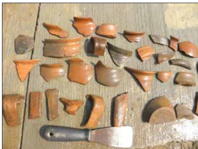
Ceramica Dridu (sec. VIII-IX)

După inventarul descoperit (numeroase fragmente ceramice de mărimi și forme diferite) avem un cuptor de "copt" ceramică, aparținând civilizației Dridu, pentru sec. VIII-IX.