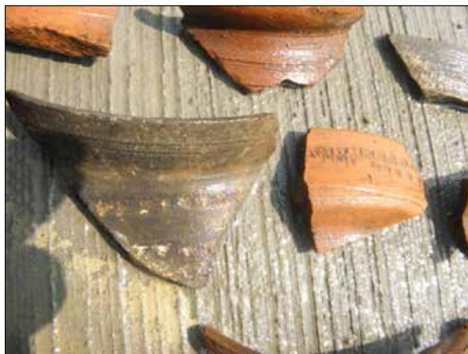
Fragmente impregnate cu incizii, linii paralele vălurite și motive de tip "colți de lup" sau "în șah"