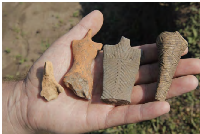
Statuete cucuteniene descoperite la Armășeni în acest an...

e-mail: revistaelanul@gmail.com http://sites.google.com/site/elanulvs/