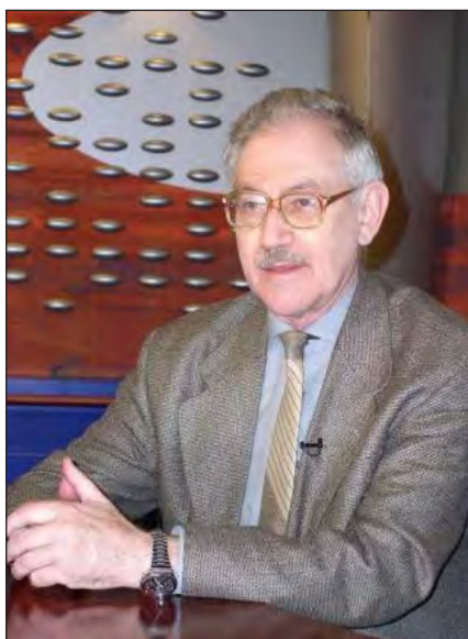
prof. univ. dr. Florin Constantiniu (n. 8 aprilie 1933, București - d. 14 aprilie 2012, București)

Ulterior, la întâlnirile stabilite de „cooperativă”, reprezentantul Securității a dorit să clarifice motivul pentru care Florin Constantiniu a vizitat ambasada Greciei, dar și ce a făcut cu prilejul ieșirilor anterioare din țară (făcute în interes de serviciu): Austria (1965),