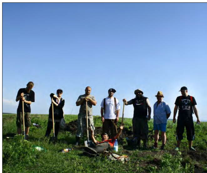
Echipa de voluntari, la începutul cercetării din acest an