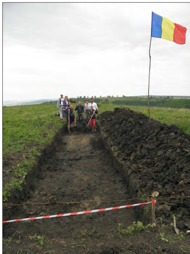
Acest loc marcat de arheologul Vicu Merlan a fost acoperit ilegal cu buldozerul

Tehnoredactare: Bogdan Artene Tipar: SC Irimpex SRL Bârlad