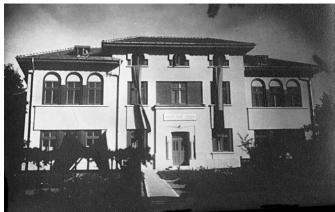
Liceul de Fete Vaslui, 1940

Moldova și, desigur, zona Vaslui a suferit foarte mult datorită faptului că aici au fost operațiuni de război. Pe acest teritoriu s-au desfășurat, în perioada aprilie-august 1944, operațiunile frontului Iași-Chișinău care au provocat mari pagube locuitorilor. În orașul Vaslui, în urma bombardamentelor aeriene din vara anului 1944, mai bine de 50% din imobile au fost deteriorate sau distruse. Din această cauză multe școli secundare au rămas fără local. Între acestea, erau: Liceul teoretic de fete și Liceul Industrial de fete, ambele cu o populație școlară destul de mare. De aceea, se propunea Ministerului Educației Naționale ca Liceul de fete să funcționeze în Cercul Militar „Mareșal Constantin Prezan” cu aprobarea Ministerului de război al cărui local era 7 .