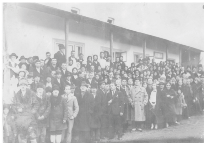
Școala din Ruși - comuna Puiești, înainte de cutremurul din 1940

facă educația și să le insufle dragostea de Țara, de Neam și Rege – respectul legilor, împlinirea datoriei. Lipsa din clasă a tabloului M. S. Regelui – Aceeși lipsă de îndrumare din partea școlii și pentru sătenii din comună” 1 .