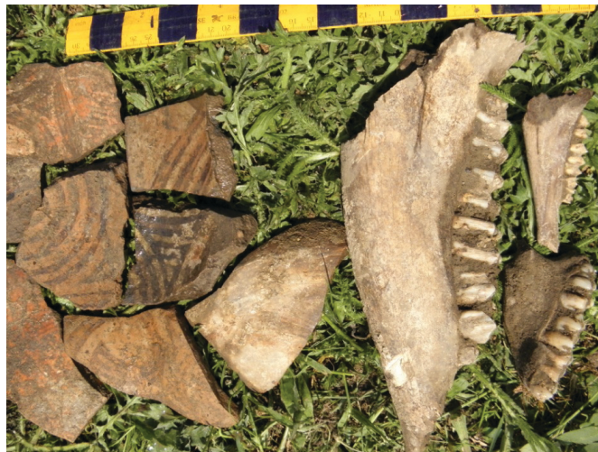
Ceramică cucuteniană pictată și fragmente osteologice

Un fragment de statueta feminină din lut ars de culoare cărămizie, păstrat de la gât până la bazin. Îi sunt conturate schematic mâinile printr-o ușoară prelungire în sus a umerilor și cea a bazinului, fiind elipsoidal în secțiune. Lățimea maximă este întâlnită în zona baziunului exprimându-se astfel funcționalitatea esoterică a statuetei ca zeiță a fertilității și a fecundității. Păstrează urme vagi de culoare roșie, de la picture