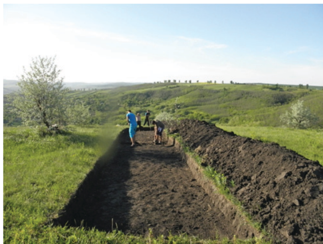
Armășeni “Muncel”, Secțiunea S8 - 2013

În cadrul campaniei din anul 2013 organizată pe Dealul Muncel, la est de satul Armășeni a fost trasată o nouă secțiune S8, paralel cu S1/2005, însă la 10 m vest de acesta. În acest spațiu dintre S1 și S8, se mai pot încă vedea două șanțuri ale secțiunilor preventive trasate în 1974 de către arheolog Violeta Bazarciuc. Despre rezultatele acestor săpături nu s-a publicat sau întocmit vreun raport de săpătură, neștiind astfel câte secțiuni s-au decopertat, deducând doar din alveolările din teren, rămase ca „amprente” ale săpăturilor din anii 70.