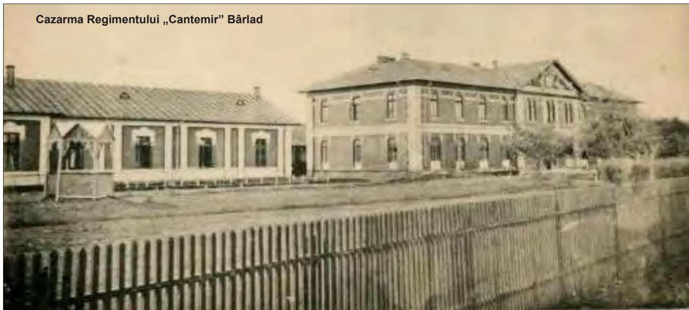
Cazarma Regimentului „Cantemir” Bârlad