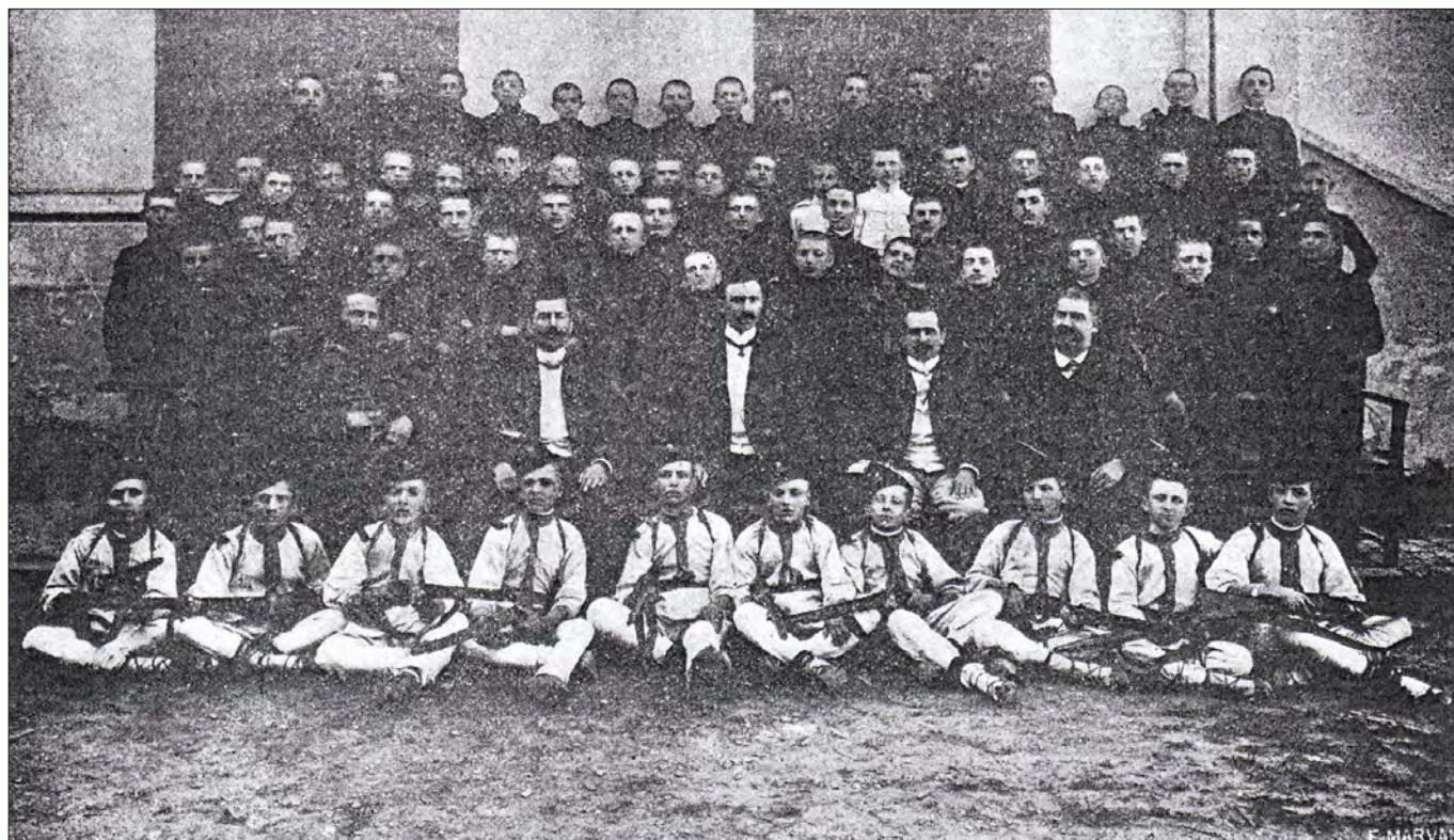
Profesorii și elevii Gimnaziului din Vaslui în anul 1910-1911

Participarea României la Primul Război Mondial în vederea realizării idealului național și retragerea în Moldova au dus la întreruperea temporară a cursurilor în majoritatea școlilor din Regat, multe din unitățile de învățământ devenind spitale. Începând cu anul 1914 și până la sfârșitul războiului