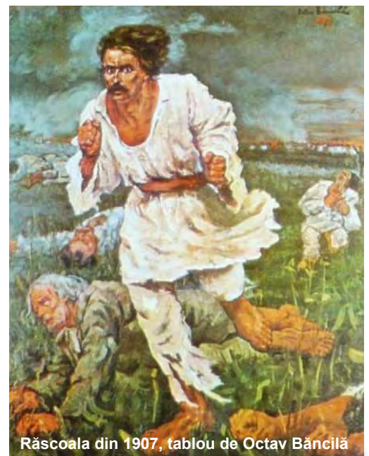
Răscoala din 1907, tablou de Octav Băncilă