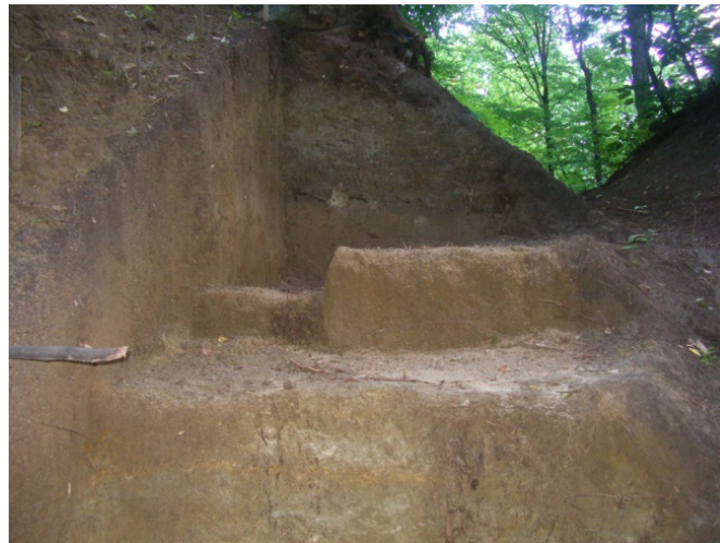
Secțiunea Ș1 – prin valul de apărare