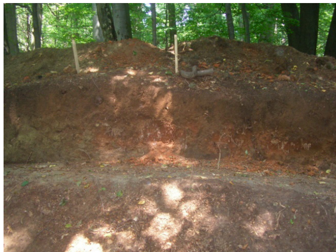
Partea superioară avalului – stratul de ardezie

La -0,80 m a fost identificat un nivel arheologic aparținând paleoliticului superior de tip gravettian (5 așchii din silex de Prut cu pigmentații albe și patină specifică). O piesă păstrează urme de cortex pe partea ventrală și pe o latură câteva rețușe ușor evidențiate. O altă piesă are urme de rețușare pe latura dreaptă și rețușe pe partea activă, care este oblică. Talonul este puțin pronunțat, păstrat parțial, iar pe partea ven-