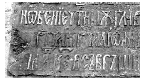
Pisania originală a bisericii din 1490

Biserica „Tăierea Capului Sf. Ioan Botezătorul” din Vaslui, ctitorită de Ștefan cel Mare în anul 1490; refăcută la 1820