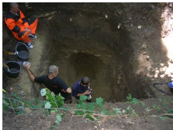
Săpătura de adâncime în mijlocul movilei