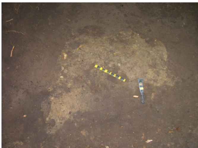
Urme de cenușă și cărbuni la baza movilei în interior