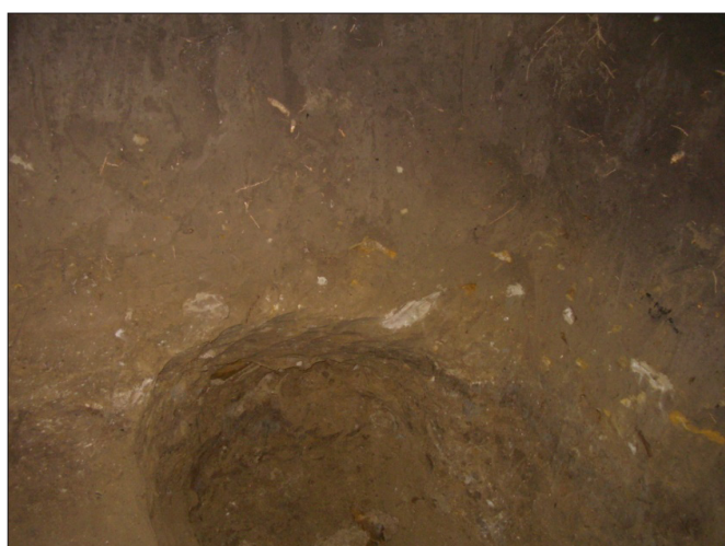
Stratigrafia movilei la bază, pe interior: pietre, cărbuni, limonit și cenușă