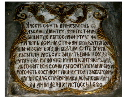
Pisania bisericii domnești refăcută în 1820