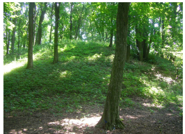
Movila - tumul