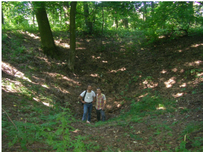
Centrul movilei excavat din vechime