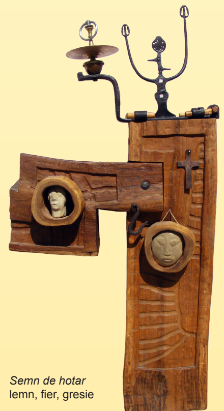
Semn de hotar lemn, fier, gresie