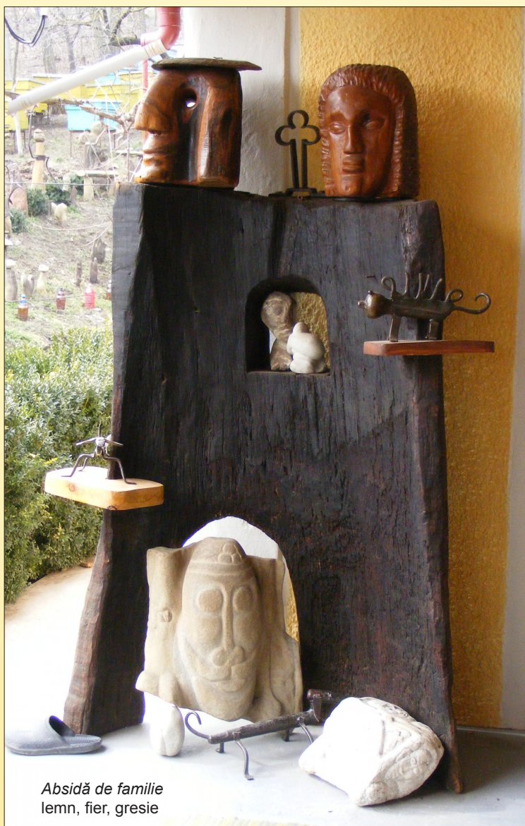
Absidă de familie lemn, fier, gresie