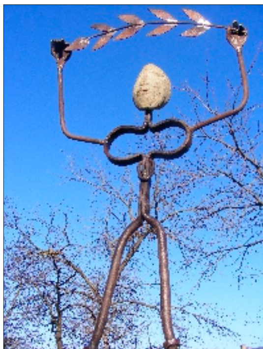
Lucrare de Marin Rotaru