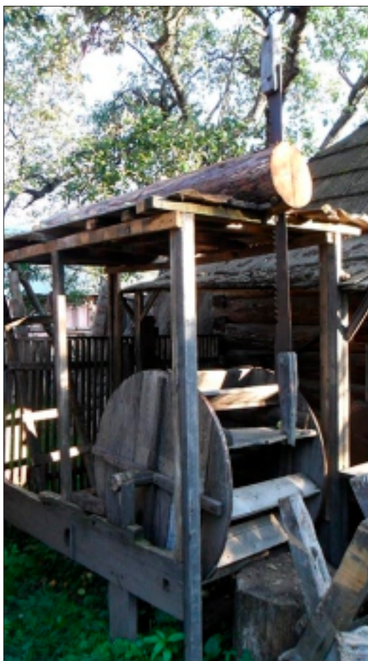
Trașca, un gater rudimentar

Străinii rămân în continuare cei care-i rezervă cele mai plăcute surprize. Așa a fost și cazul unui grup de japonezi, veniți mai deunăzi să vadă cu ochii lor cum trăiau bucovinenii în