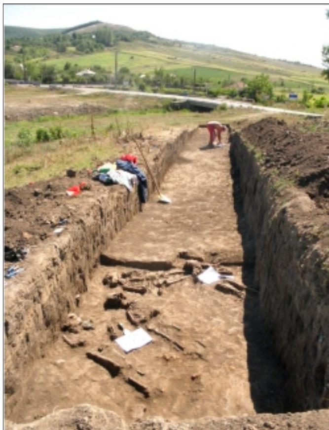
Secțiunea Ș 12 – vedere generală

gâtului până la piept, alcătuit din peste 200 de piese cu dimensiuni mici și foarte mici ( \varphi = 0,2 - 0,4 cm), probabil lucrate din os sau semințe de plante. Sunt friabile, distrugându-se