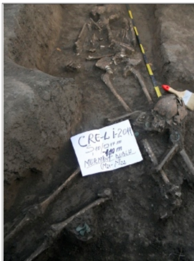
Mormânt dublu M 21 -M 22

În zona pieptului a fost găsită o fibulă alcătuită din două piese puternic corodată pe capete. La un capăt prezintă o sârmă, care face legătura cu cealaltă latură a arcului. Un capăt este lat și subțiat (2 cm), ușor întors pentru prinderea sârmei, mijlocul de 1 cm (zona maximă de arcuire) prezintă o proeminență, după care se îngustează gradat spre urechea agrafei. Cealaltă piesă este identică, fiind prinsă de prima printr-o prelungire de 1 cm. Arcul are 7 cm lungime și l = 4 cm.