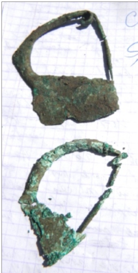
Fibule din bronz – Mormântul M 24