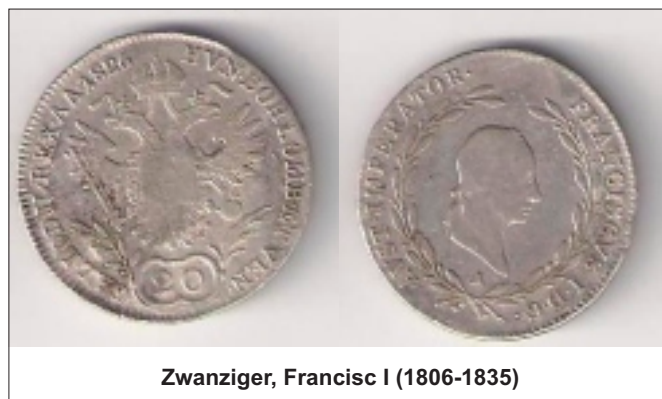
Zwanziger, Francisc I (1806-1835)

O primă încercare legislativă de reglementare a circulației monetare a fost făcută prin Regulamentele Organice din Țara Românească (1831) și Moldova (1832). Prin aceste documente se adoptă bimetalismul, raportul dintre aur și argint fiind stabilit de stat. Ca etalon aur a fost ales ducatul (galbenul olandez), piesă ce avea 3,49 g. cu titlu 900 ‰ iar ca etalon de argint sfanțul (zwanziger, piesa de 20 creițari), monedă austriacă ce avea 6,68 g. cu titlu 583 ‰. Ambele monede erau echivalate în lei de calcul: ducatul valora 31 lei și 20 parale iar sfanțul 2 lei și 10 parale 3 . Cursurile celorlalte monede se stabileau tot în lei în funcție de valoarea lor față de leul de calcul.