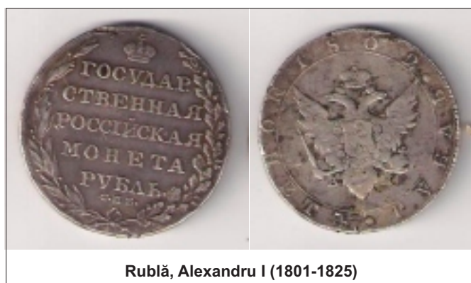
Rublă, Alexandru I (1801-1825)

În această perioadă circulau în Principate peste 80 de semne monetare diferite ca aliaj și sistem ponderal ceea ce a determinat o gravă dezordine în circulația monetară. Mai mult, fluctuațiile numeroaselor cursuri de schimb favorizau speculațiile comerciale ceea ce însemna pierderi importante pentru populație, prin diferența de curs dar și pentru stat, în special în relațiile cu puterea suzerană față de care aveam de făcut diverse deconturi sau plăți. Datorită necesității realizării plăților în monede cerută de creditor (visteria statului, de exemplu, nu primea monede turcești ci doar piese de bună calitate) crește importanța economică a zarafilor care vor folosi cursul de schimb a diverselor monede pentru realizarea unor operațiuni speculative.