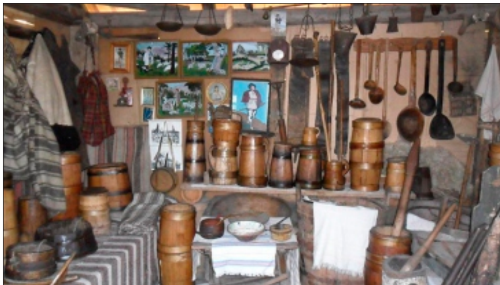
Inventarul stânei de la munte

de vaci. Tata era și el printre cei care păzeau oile, deși avea doar 9 ani. Într-o zi au venit austriecii și, sub pretextul că venea războiul și că cei mici trebuie protejați, l-au luat pe tata cu tot cu oi și încă alți 50 de copii din Bucovina și i-au dus tocmai la Viena.