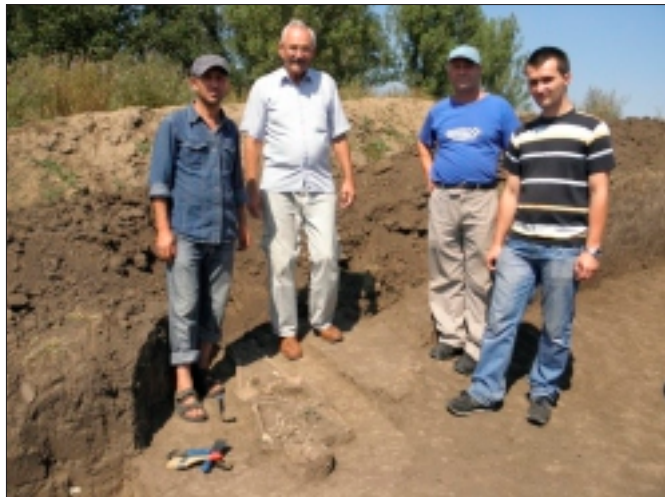
Descoperirea mormântului M21 – colaborare interdisciplinară Huși-Iași-Bârlad

Trebuie specificat că din numărul total amintit, 5 morminte avea în inventarul osteologic doar craniul, unele au părți lipsă din trup (de exemplu bazinul sau coloana și coastele sau picioarele), fapt pus pe seama unor decapități războinice, accidente, atacul unor animale sălbatice, sau poate chiar măcinarea lor de timp (circa 3000 de ani).