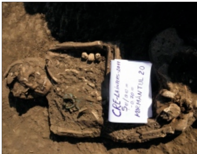
Mormântul nr. 20 - detaliu