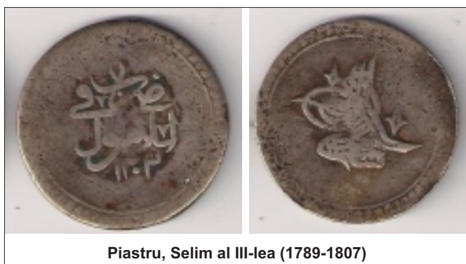
Piastru, Selim al III-lea (1789-1807)

La începutul secolului al XIX-lea circulația monetară din Principate se desfășura în condiții dificile datorită lipsei unei monede naționale și existenței pe piață a numeroase monede străine, în special turcești, rusești sau austriece: piastru turcesc, monede de 20 de kreutzeri, rubla rusească, mahmudeua, icosarul, ducatul unguresc, moneda de 20 de franci, ducatul (galbenul), austriac, ducatul olandez, lira sterlină, talerul de Prusia ș.a. O mare parte din moneda aflată în circulație este însă din metal comun cu valoare intrinsecă inferioară celei de schimb.