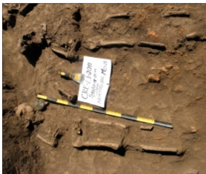
Mormântul dublu M 23 -M 24

Mormântul nr. 23 era într-o stare avansată de degradare, lipsindu-i labele picioarelor și mâinile.