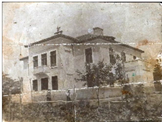
Conacul Gugești, sediu de colhoz