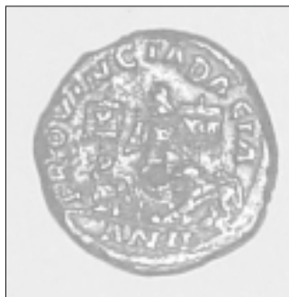
AE. Sestert Filip Arabul (244 – 249). Atelier probabil Sarmisegetusa. Anii iulie 247- iulie 248. An II. Tip B 3 . Colecție C.Giurcanu.