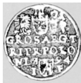
AR. Trojak. Polonia.. Sigismund III Wasa (1587-1632). Atelier Olkusz. Jan Firlej, mare vistiernic al Poloniei, 1590 - 1609. Anul 1594. 7