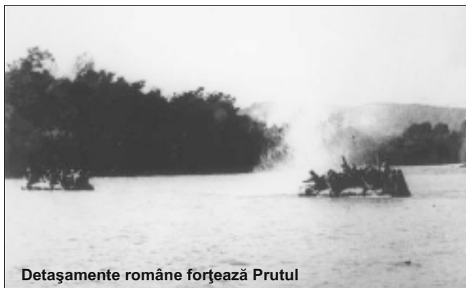
Detașamente române forțează Prutul

Ca orice moment crucial al istoriei naționale, 22 iunie 1941 este obiectul unor interpretări și controverse dintre cele mai diversificate. Ele oscilează între două extreme: atașamentul afectiv bazat pe cunoașterea directă a evenimentelor, atât prin tradiții de familie, cât și prin analiza documentelor, și, cealaltă tendință, prin care se urmărește demonizarea românilor, a faptelor și credințelor care i-au călăuzit. Ultima atitudine s-a conturat mai întâi ca servilism îngenunchiat al unor jalnici istorici români față de ocupanții sovietici, actualmente servilismul acestora, dintr-o nouă generație, devenind multilateral dezvoltat, în slujba oricui este dispus să înjure România.