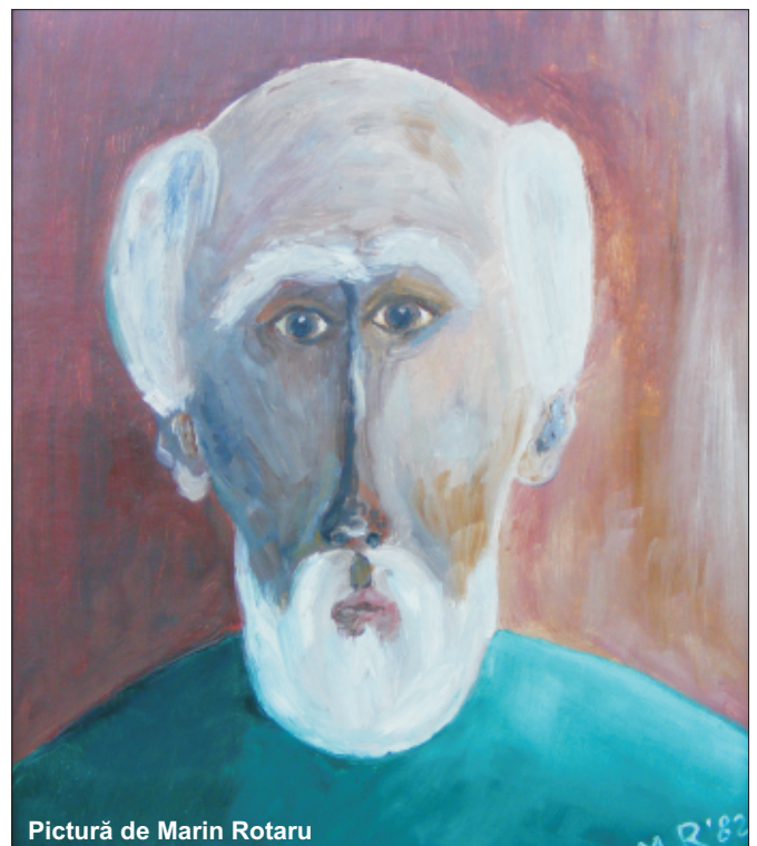
Pictură de Marin Rotaru

Cu un aparat critic bine realizat, beneficiind de un indice de nume de persoane și de locuri, care ușurează consultarea, de un număr de 37 de planșe, ce reînvie din vechime documente, hărți și portretele principalilor pionieri ai conflictelor militare și înaltelor fețe bisericești, moldovene sau impuse de ruși, lucrarea reprezintă un important reper pentru cunoașterea perioadei fanariote a statului medieval de la răsărit de Carpați și a evoluției instituțiilor ecleziastice.