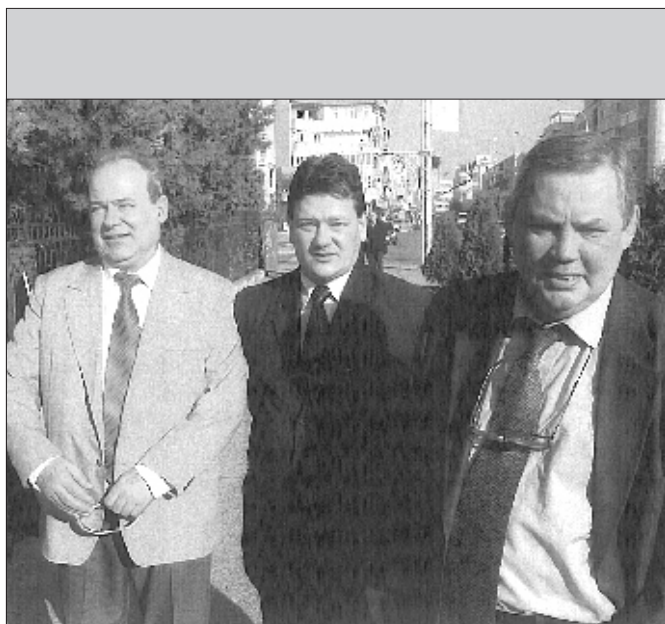
Trei Crai spre Răsărit și... unul a Apus !

Era de un optimism molipsitor, bun la suflet, dar s-a dus în lumea stelelor să-și sărbătorească vârsta de 60 de ani.