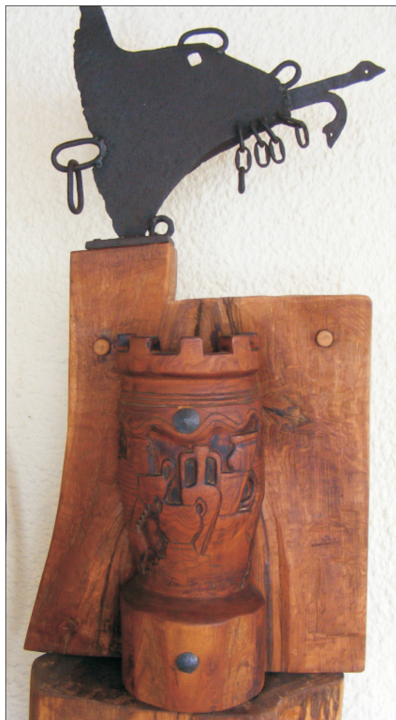
Sculptură de Marin Rotaru.

Opera lui Costachi Conachi își are locul de cinste în sfera patrimoniului spiritual național românesc.