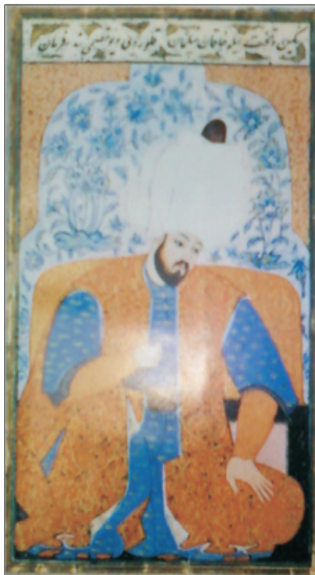
Soliman Magnificul 1520-1566

În fine, trebuie să subliniez că, cel care a transformat Mediterana orientală și centrală într-un lac turcesc s-a stins din viață la 10 septembrie 1566 într-un moment în care Europa se temea de forța militară a imperiului turc ce visa la cucerirea inimii sale 21 .