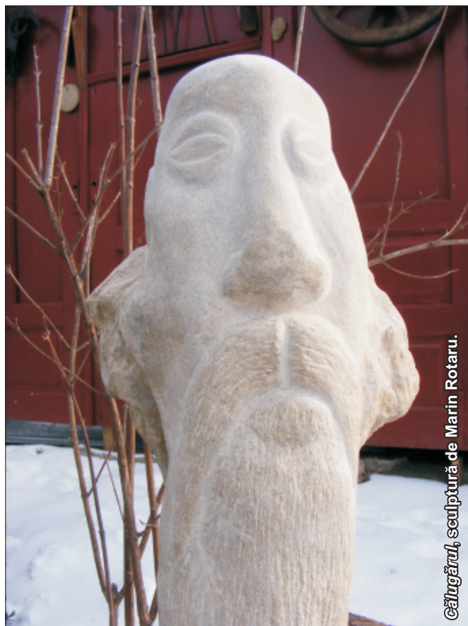
Călugărașul, sculptură de Marin Rotaru.