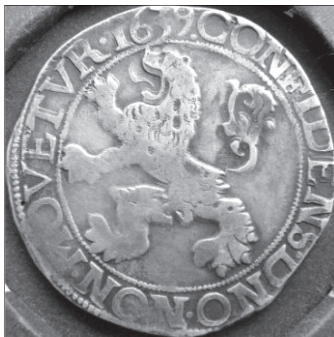
Taler-leu olandez, emis în 1639.