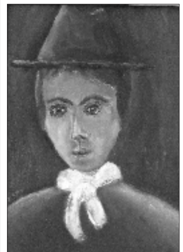
Pictură de Marin Rotaru.

Din hornuri înalte, fum cenușiu Se-mprăștie în satul pustiu. Sătenii adorm și visează, Iar Domnul de Sus îi veghează.