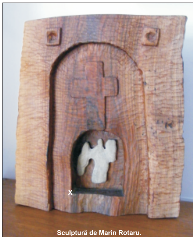
Sculptură de Marin Rotaru.

Încheind aceste rânduri, avem convingerea că o nouă ediție a lucrării, mai amplă și mai bine îngrijită de editură, bazată pe sugestiile cititorilor, cărora se adresează această carte, va putea acoperi întreaga problematică a evoluției învățământului din comună.