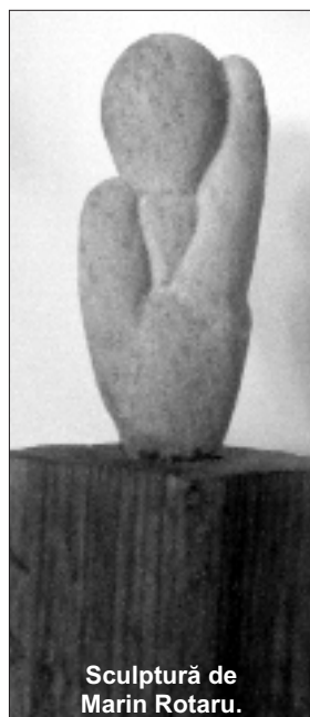
Sculptură de Marin Rotaru.