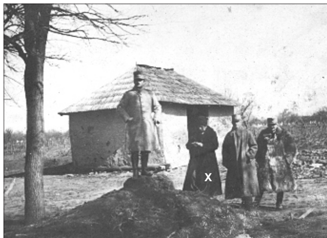
25 februarie 1918. Satul Troțușanul. Postul de Comandă nr. 1 din care nu a rămas decât casa unde erau telefoanele. Se văd însă ruinele a două case: Biroul operațiilor și casa de locuință a generalului Cihoski. Generalul Cihoski este urcat pe movilița de unde a primit acțiunea în zilele de 1-6 august 1917 (Bătălia de la Mărășești).

În fotografie: General Cihoski, Poetul Alex. Vlahuță, maiorul Placa (Șef birou informații Armata I-a) și maiorul Dimitriu Haralambie (șef biroului adjutantului Divizia 10)